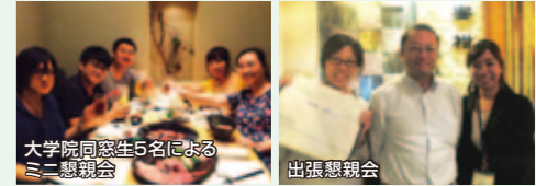
大学院同窓生5名によるミニ懇親会