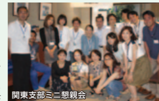
関東支部ミニ懇親会

7月20日(日)、関東支部としては初の試みとなるミニ懇親会を開催。関東地区で同窓生の「輪」を更に広げる活動の一環として、新たに関東に転入した同窓生17名を対象に、トラットリアドーニ道玄坂(東京都渋谷区)にお迎えした。出席者の年齢層は20代から60代までと幅広く、年齢の垣根を越えて、大いに話題が盛り上がった。