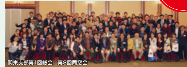
関東支部第1回総会 / 第3回同窓会