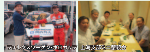
フォルクスワーゲン・ポロカップ